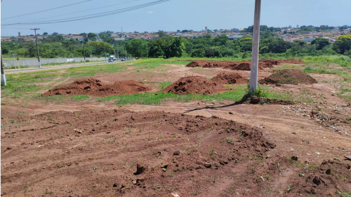
Foto 03: Tirada nesta data - Vista da área C1, adjacente a área objeto de avaliação.